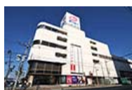
テーオー テーオーデパート