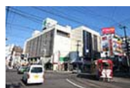
行啓通り 近くに五稜郭本町の中心街