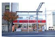
ハセガワストア 焼き鳥弁当