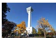
五稜郭タワー 函館市内一望