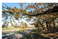
五稜郭公園 散歩や運動に