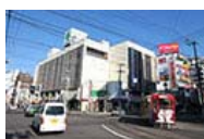
行啓通り 近くに五稜郭本町の中心街