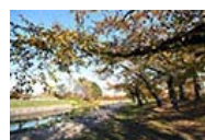
五稜郭公園 散歩や運動に