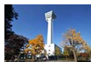
五稜郭タワー 函館市内一望