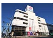
テオー テオーデパート