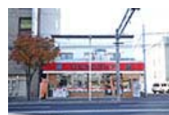
ハセガワストア 焼き鳥弁当