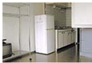
リビングへキッチン